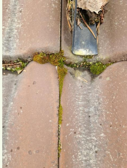
Tiilen saumoissa sammalkasvustoa.