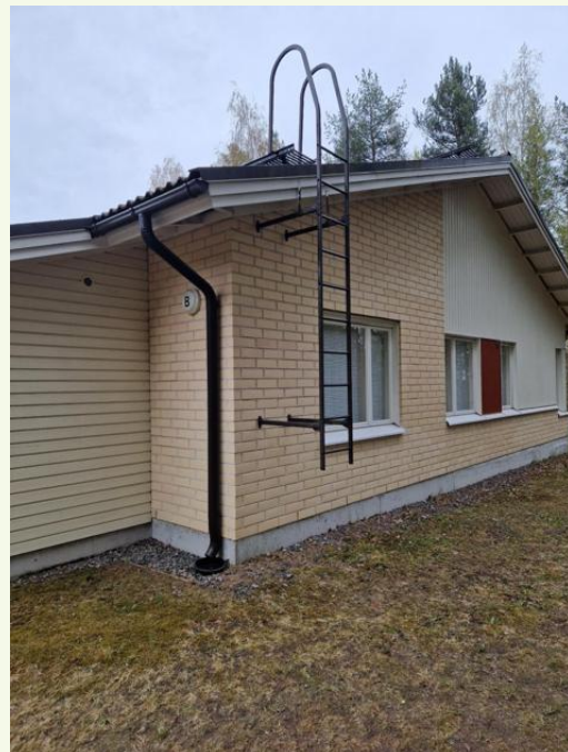
Tikkaat ok, kiipeilyesteitä suositellaan lisäävän (estetään lasten kiipeäminen katolle)