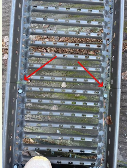
Kattosiltojen kiinnitykset tehty puutteellisesti, jatkosista puuttuu toiset pultit kokonaan.