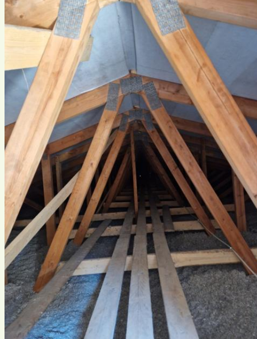
Yläpohjassa ei vuotohavainnointia