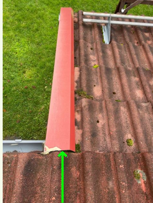
Lippojen kohdalla vesi pääsee reunapeltien yläosasta lahottamaan reunalaudat. Tiivistyslevyt 5kpl olisi suositeltavaa lisätä.