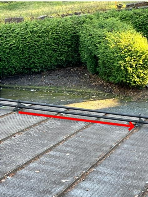
Lumiesteet räystäällä koko matkalta. Kaksi kohtaa, jossa yli pitkä kannakejako.