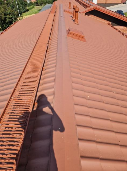
Harjapellit kiinni ja hyvässä kunnossa.