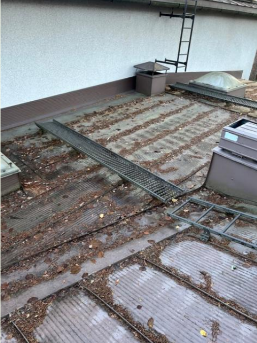
Kulkutiet tehty kattosiltoja ja lapetikkaita pitkin huoltokohteille.