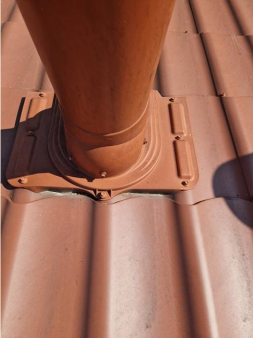
Katon läpiviennit hyvässä kunnossa.