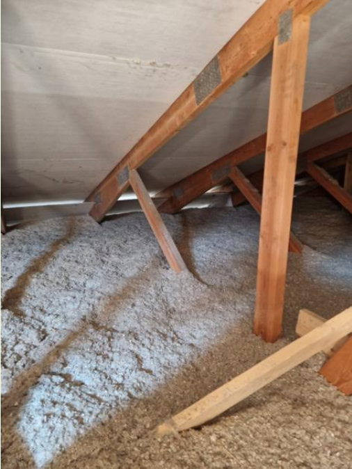
Tuuletus kunnossa, aluskatteen limitykset ok.