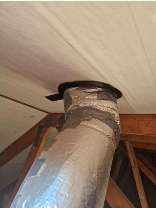
Läpiviennit tiivistetty aluskatetiivisteillä.